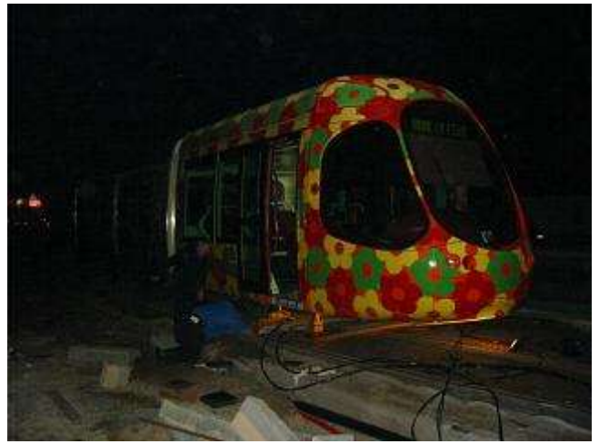
Photo 1 : Ripage centimètre par centimètre de la motrice au moyen de vérins.