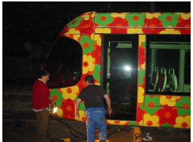
Photo 2 : Un petit projecteur pour tout éclairage. L'apport de lumière du flash du numérique d'Eric Boisseau n'a duré que le très très court espace de temps de la prise de vue.

- 27 novembre 2006 - Suite de l'info du 26 novembre 2006 ci-dessus. Le ripage de la motrice sur voie 1 a été achevé ce lundi 27 novembre 2006 aux environs de 13 heures. A 14 heures le personnel des TaM attendait la remise en tension de la ligne aérienne de contact afin que la rame 2053 Citadis 302 Alstom puisse partir en direction du dépôt "La jeune Parque" pour y subir quelques contrôles. La manoeuvre consistait notamment à repasser sur l'aiguillage incriminé mal négocié la veille pour regagner la voie 2 menant vers Montpellier. La défaillance de l'appareil de voie à l'origine de la "bivoie" résulterait d'une panne électrique. Des techniciens de la société Vossloh-Cogifer spécialisée dans la fabrication des appareils de voie, devaient intervenir le 28 ou le 29 novembre 2006 pour rechercher l'origine de la panne.